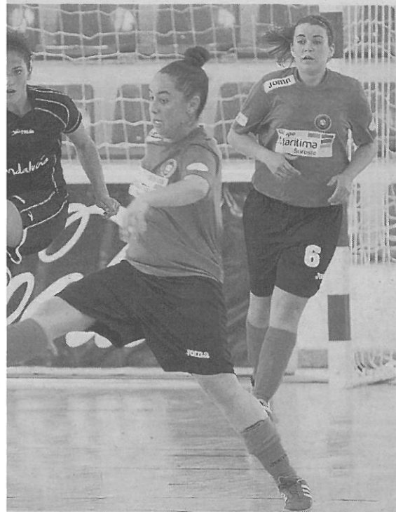
Granada y el Roldán.

El mexicano fue una de las principales claves de la reacción local, que se encontró con un 'touchdown' adverso al variar la táctica habitual de la carrera interior por un largo pase que sorprendió