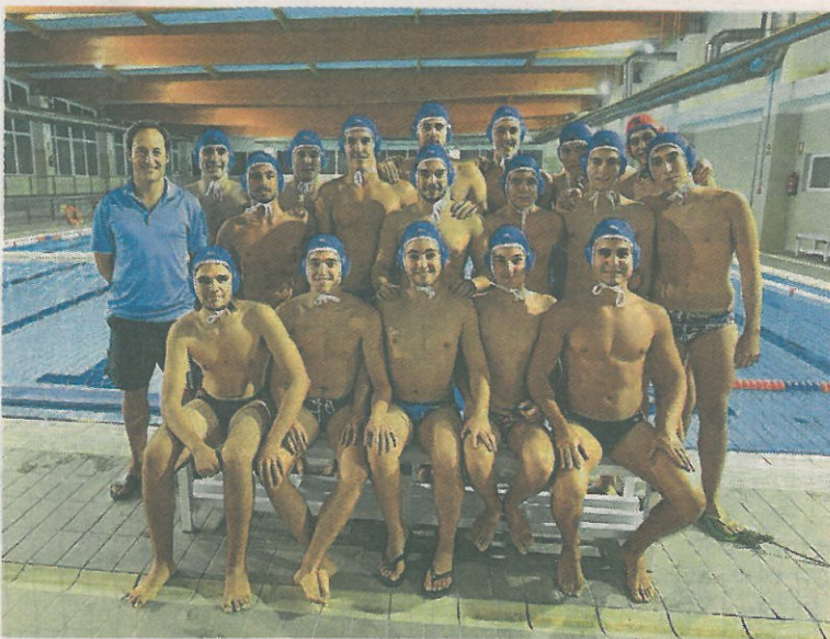
Componentes del equipo de waterpolo de Huétor Vega.