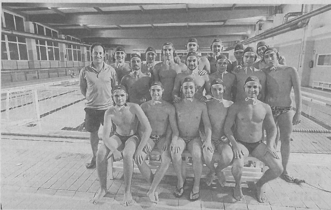
Componentes del Huétor Vega posan en la piscina municipal.

eso hay que estar fuertes. Ahora mismo el rival no puede mantener nuestro ritmo a partir del final del tercer cuarto y el comienzo del último». Ese es uno de los motivos por los que el casillero de victorias de los granadinos en esta fase final se iguala con el de partidos disputados.