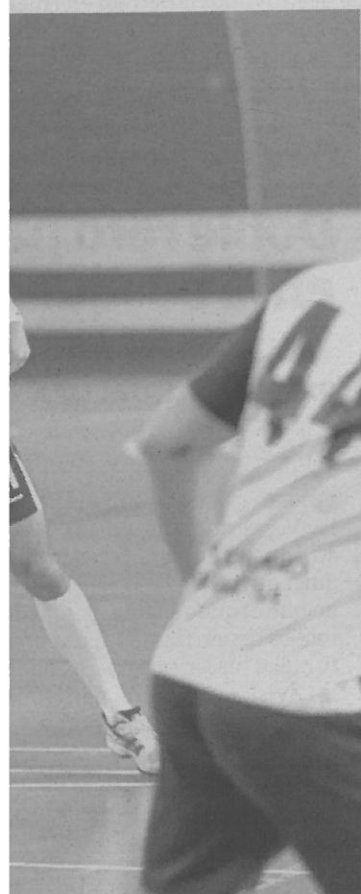
un duelo anterior.

GRANADA. El Maracena STG Itea concluye esta tarde (18 horas) su andadura como local en Primera Estatal masculina en su encuentro ante el grifluide La Salle. En este encuen-