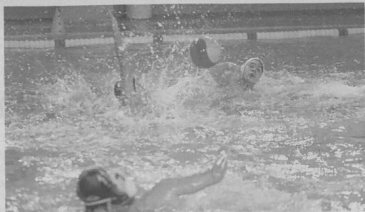
Los jugadores del Inacua disputan el esférico.