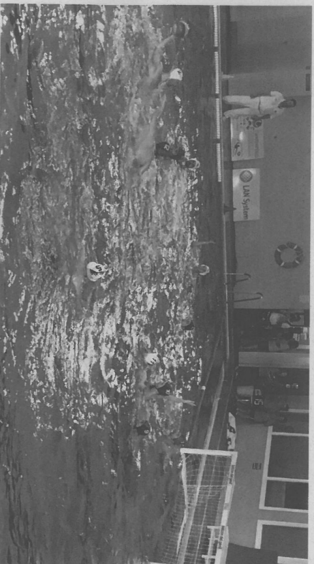
Lanzamiento lejano del Inacua Huétor Vega en el partido de ayer contra Ciutat.

Aun así, el mando correspondió siempre a los anfitriones, pues los insulares apenas crearon peligro con lanzamientos lejanos y el acierro